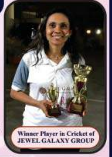
Winner Player in Cricket of JEWEL GALAXY GROUP